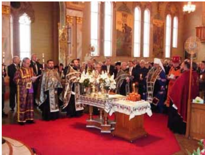
Митрополит УПЦК Юрій та Єпископ УГКЦ Торонто Стефан Хміляр служать панахиду в пам'ять жертв Голодомору-Геноциду в Катедрі св. Володимира УПЦК Торонто.

Після громадської зустрічі відбулася зустріч із провідниками Конгресу Українців Канади, відділ Торонто. Тут